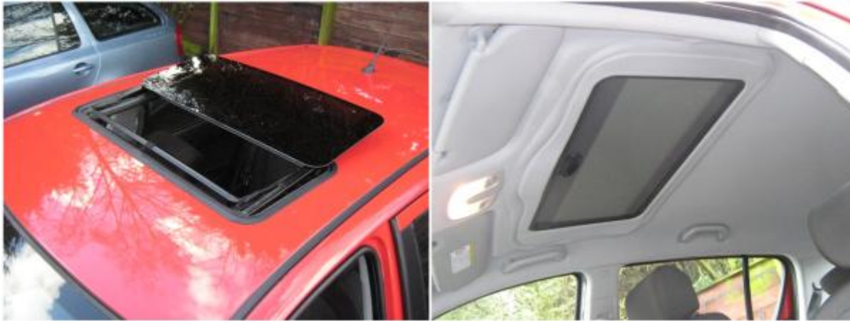
Hyundai i20, 2009, Hollandia 300 DL M