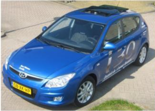
Hyundai i30, 2007, Hollandia 500