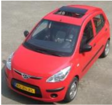
Hyundai i10, 2008, Hollandia 300 DL M