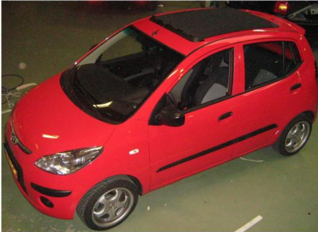
Hyundai I10, 2008, Hollandia 400 Deluxe